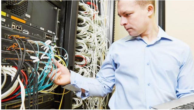
Figure 2: testez votre maîtrise du réseau